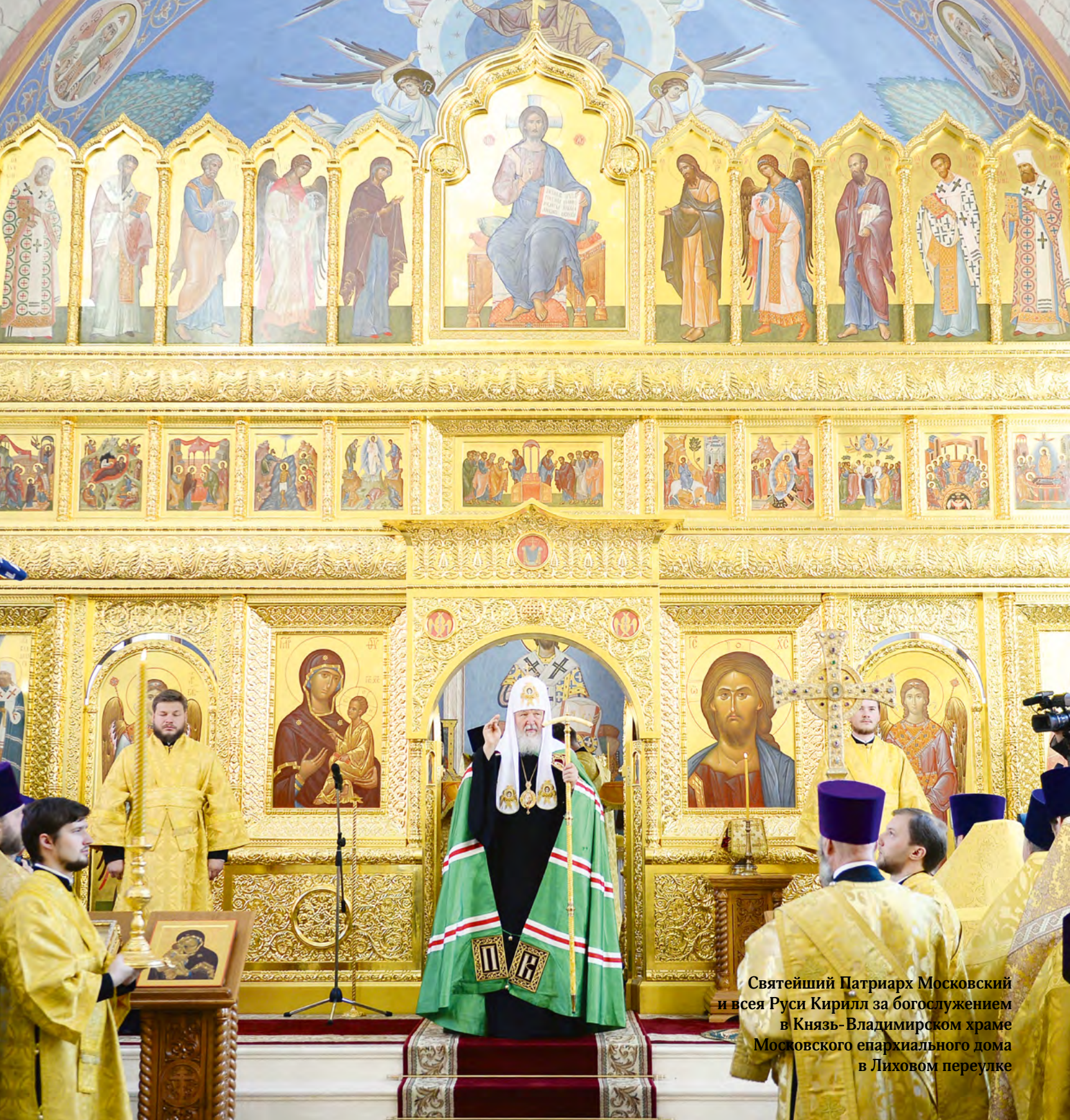
Святейший Патриарх Московский и всея Руси Кирилл за богослужением в Князь-Владимирском храме Московского епархиального дома в Лиховом переулке