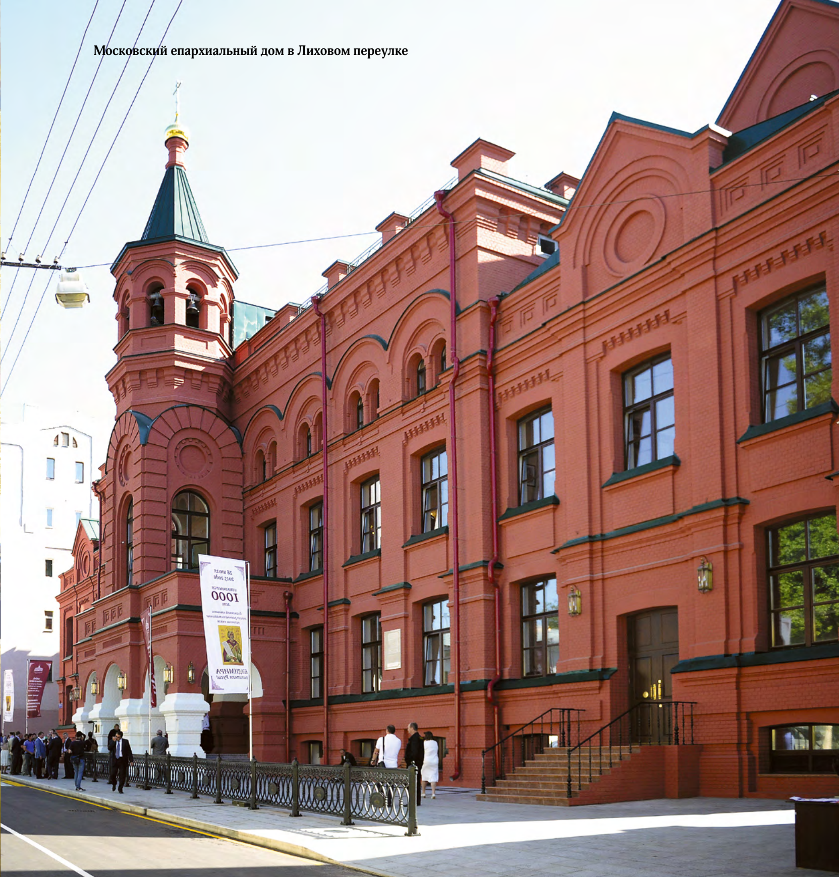
Московский епархиальный дом в Лиховом переулке