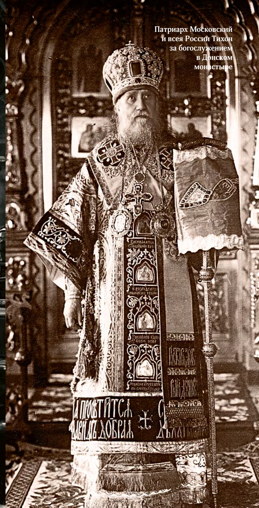
Патріарх Московскій и всея Россіи Тихон за богослуженіем в Донском монастыре