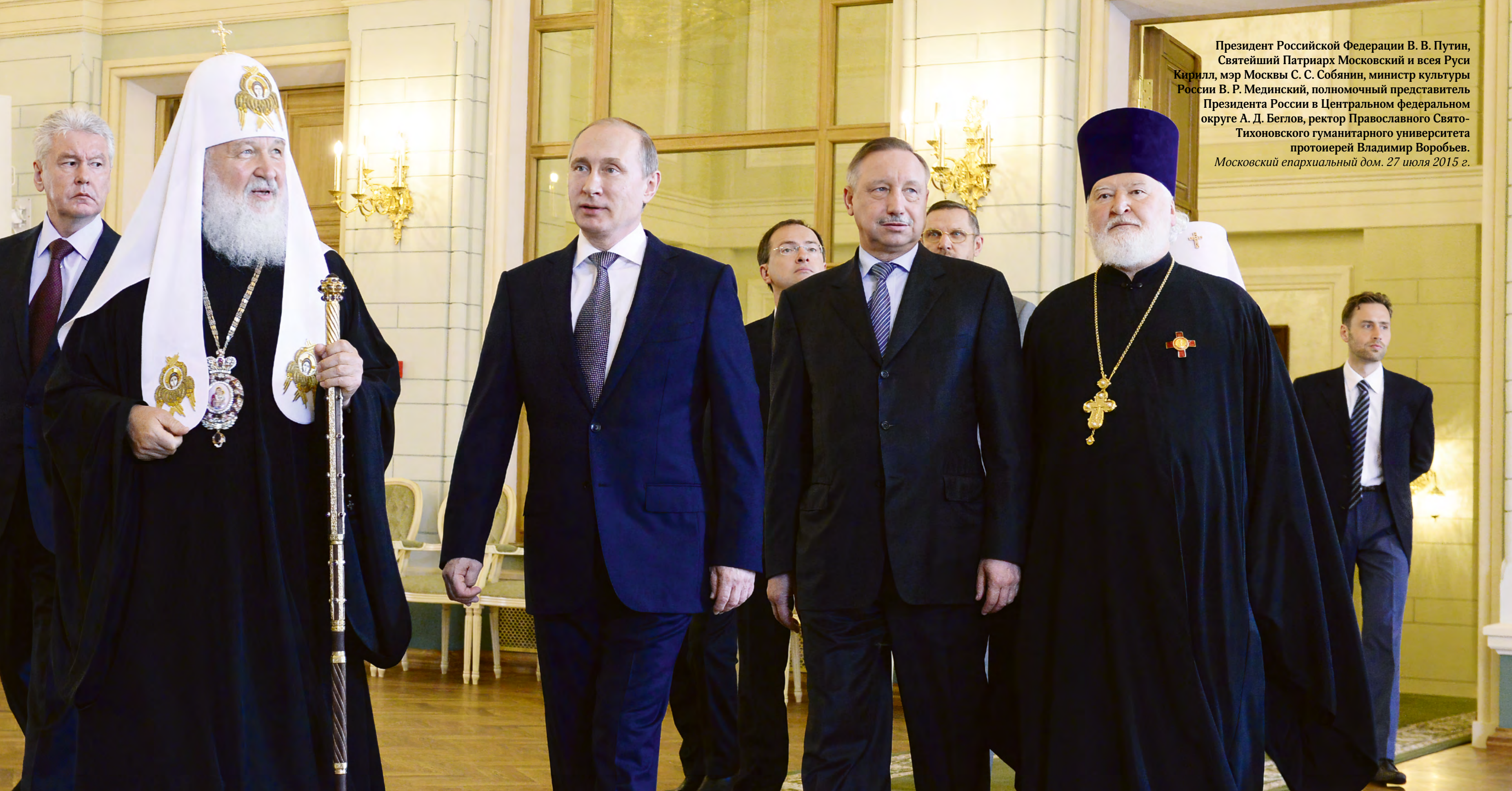
Президент Российской Федерации В. В. Путин, Святейший Патриарх Московский и всея Руси Кирилл, мэр Москвы С. С. Собянин, министр культуры России В. Р. Мединский, полномочный представитель Президента России в Центральном федеральном округе А. Д. Беглов, ректор Православного Свято- Тихоновского гуманитарного университета протоиерей Владимир Воробьев. Московский епархиальный дом. 27 июля 2015 г.