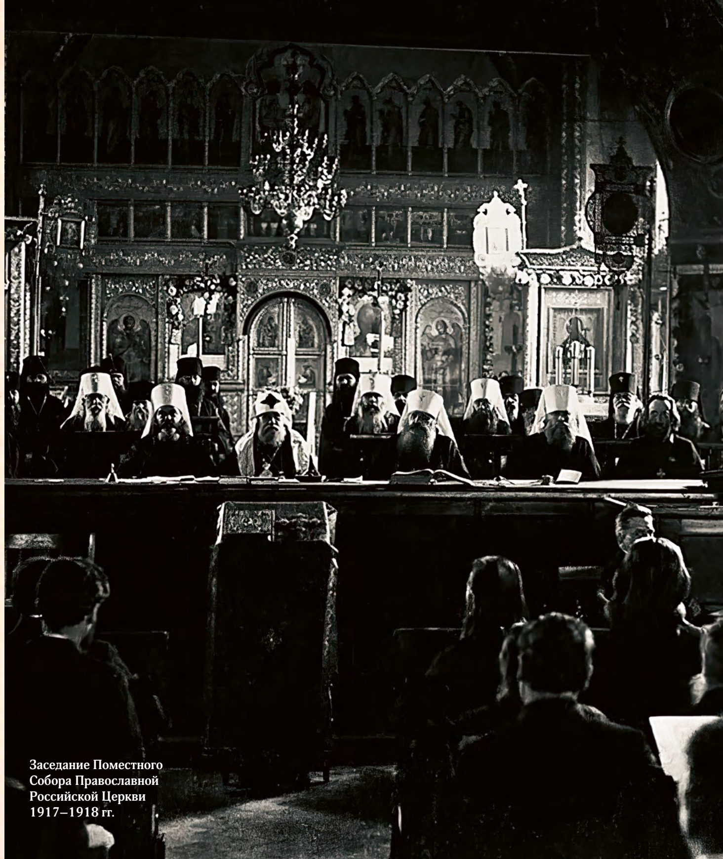
Засѣданіе Поместнаго Собора Православной Русской Церкви 1917–1918 гг.