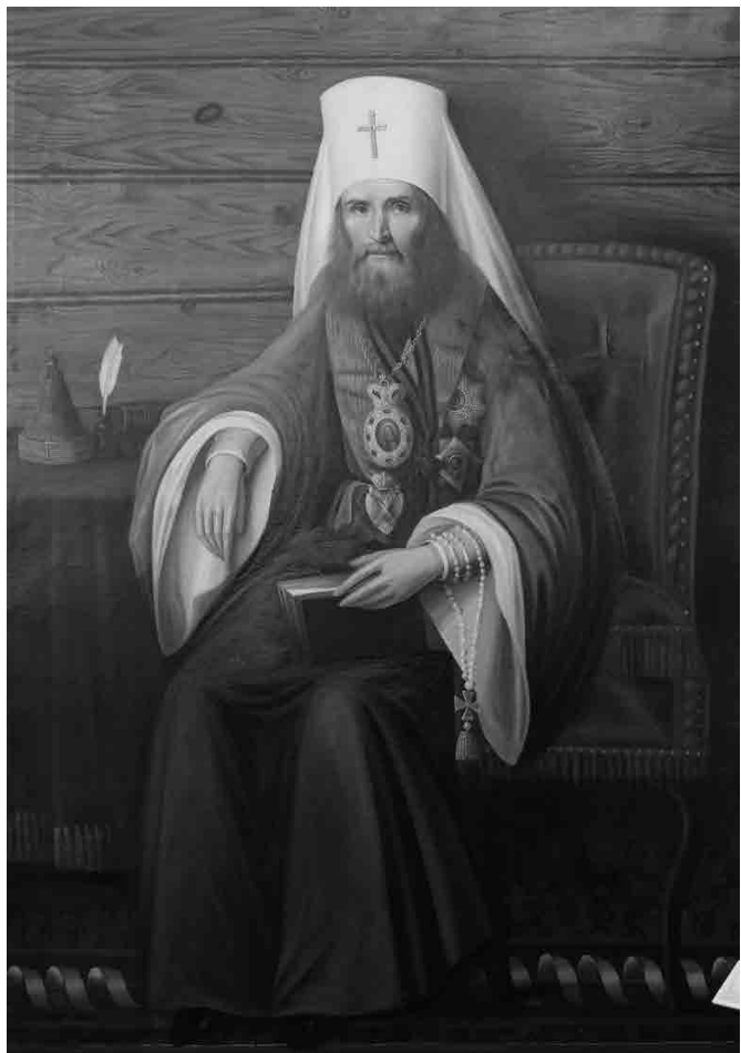
Святитель Филарет, митрополит Московский