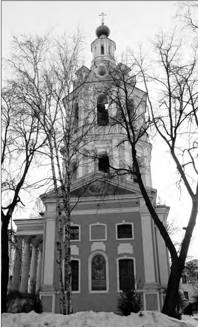
Москва. Андреевский мужской монастырь. Церковь Иоанна Богослова в колокольне монастыря

этому не научишь. Лентяй, разгильдяй, пустой мечтатель, который, как говорится, «ворон считает», звонарем не станет. Полгода упорной тренировки — и любой научится звонить. Только вот своему стилю научить невозможно: тут уж Божий дар. А благодарность Богу — верность дару, дисциплина и самоотверженность. Без них Господь может и дар Свой отнять.