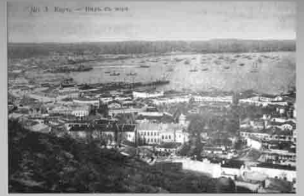
Керчь. Вид с моря