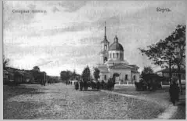
Керчь. Соборная площадь