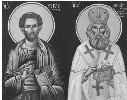
Св. апостол и евангелист Лука, святитель Лука исповедник, архиепископ Симферопольский. Греция, современное письмо

Луко преславный, подобно Евангелисту и Апостолу Луце, ему же тезоименит сый, от Бога дар целити недуги человеческия приял еси.